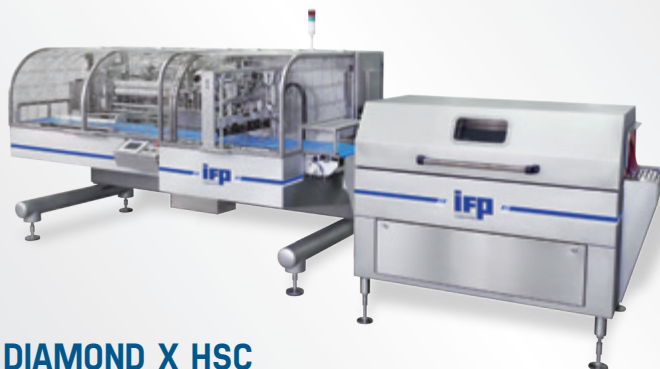
DIAMOND X HSC VERSIONE INOX + TUNNEL