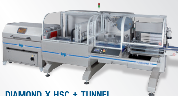
DIAMOND X HSC + TUNNEL