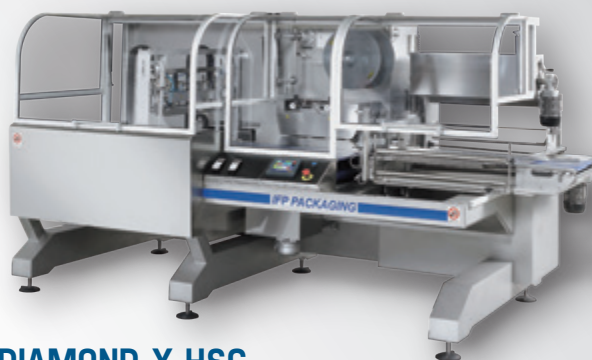
DIAMOND X HSC