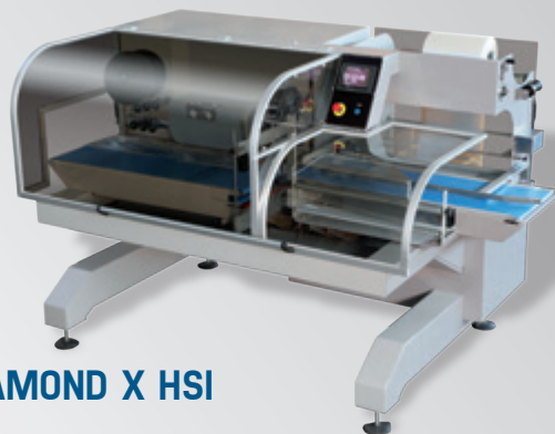
DIAMOND X HSI

Tutte le confezionatrici della gamma IFP Diamond X sono particolarmente versatili e progettate per confezionare prodotti singoli con o senza vassoio, utilizzando film termo-retraibile e non.